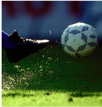
Cambio de Forma